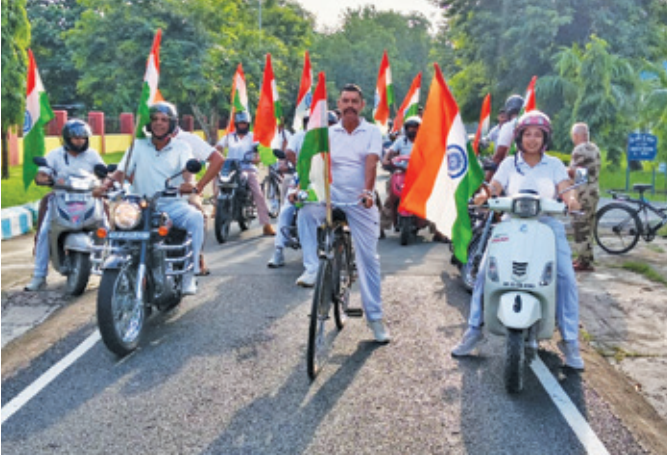
एयुजीपीपी इटावा (उत्तर प्रदेश)