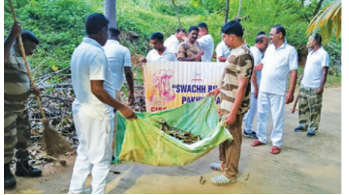
विशाखापट्टनम एयरपोर्ट (आन्ध्र प्रदेश)