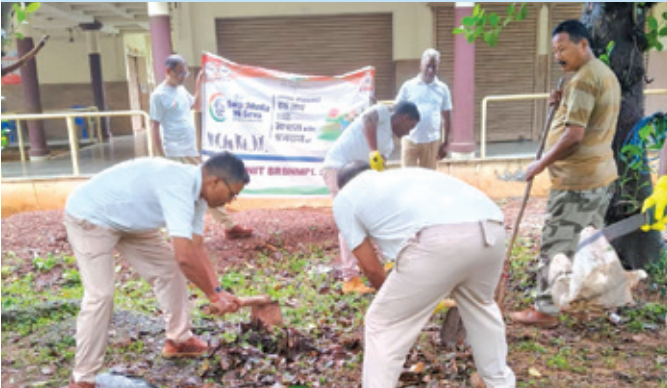
बीआरबीएनएमएल सालबनी (पश्चिम बंगाल)