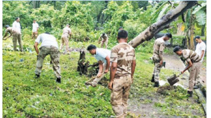
सीसीएल करगली (झारखंड)