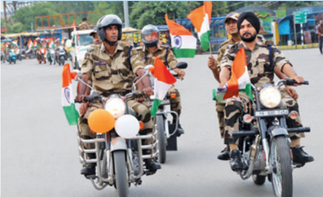
केएसटीपीपी कोरबा (छत्तीसगढ़)