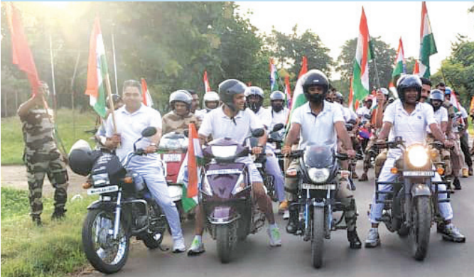
सीएनपी नासिक (महाराष्ट्र)