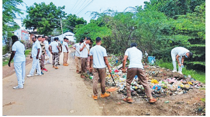
मदुरै एयरपोर्ट (तमिलनाडु)