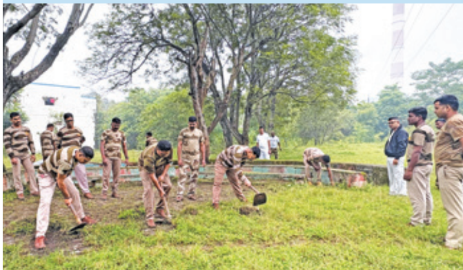
केएसटीपीपी कोरबा ( छत्तीसगढ़ )