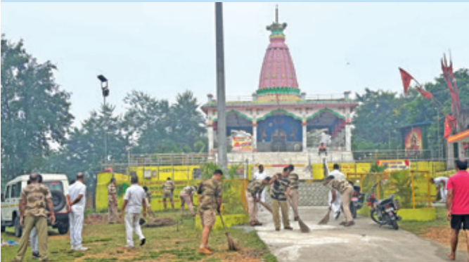
सीटीपीएस चन्द्रपुरा (झारखंड)