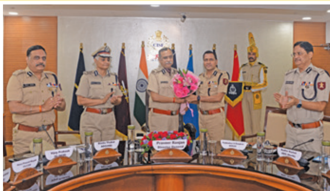
Shri Praveer Ranjan, IPS, DG CISF being honoured with bouquet by Shri P S Ranpise, ADG (South) during charge assumption