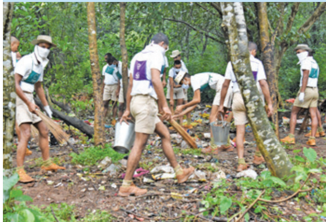
केआरटीसी मुंडली ( ओडिसा )