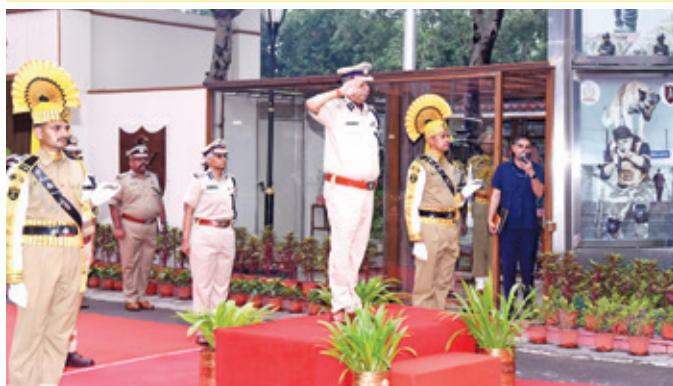
Shri Praveer Ranjan, IPS, DG CISF was conferred the Guard of Honour at CISF HQs, New Delhi