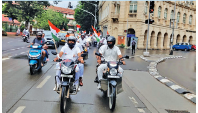
आईजी मिंट मुंबई (महाराष्ट्र)