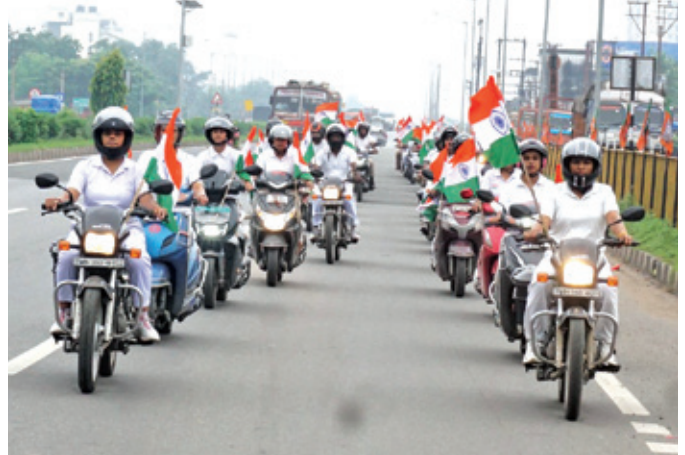
डीएसपी दुर्गापुर (पश्चिम बंगाल)