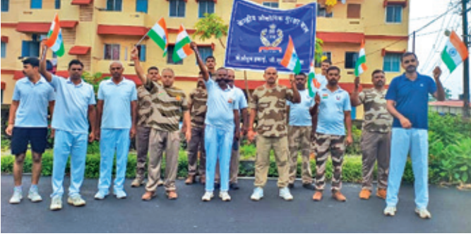
केएचएसटीपीपी कहलगांव ( बिहार )