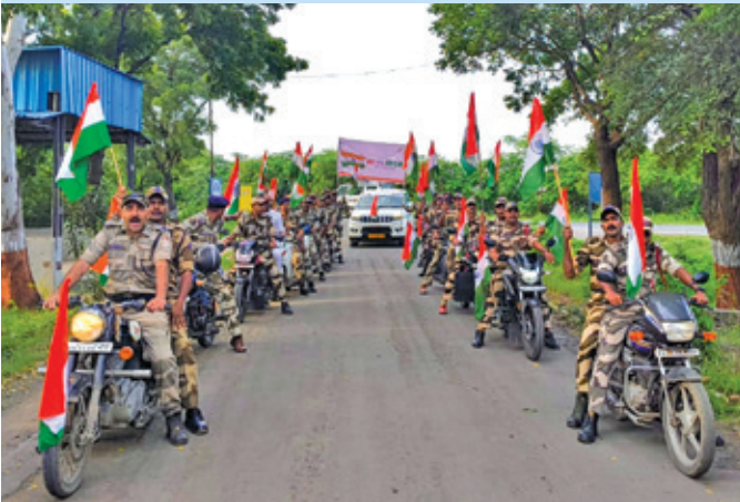
ओएनजीसी गंधार (गुजरात)