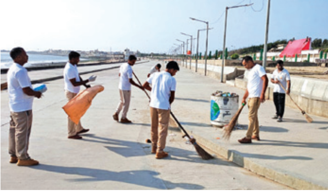
पोरबंदर एयरपोर्ट (गुजरात)