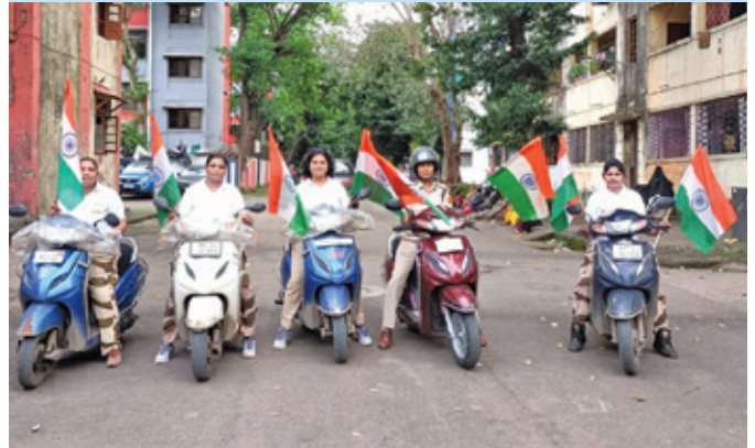
एमपीए मुंबई (महाराष्ट्र)