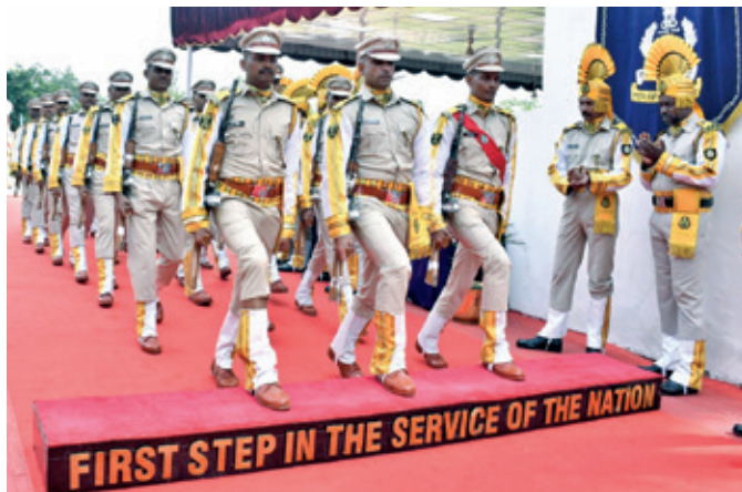
Contingents passed out and stepped into the service of the nation