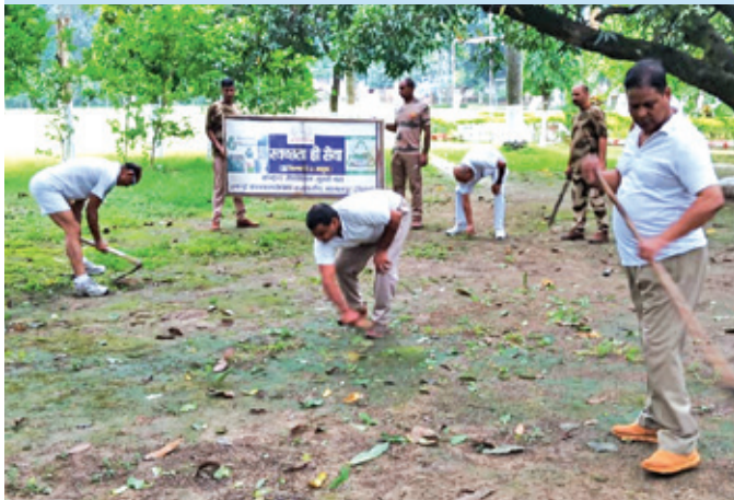
केएचएसटीपीपी कहलगांव ( बिहार )