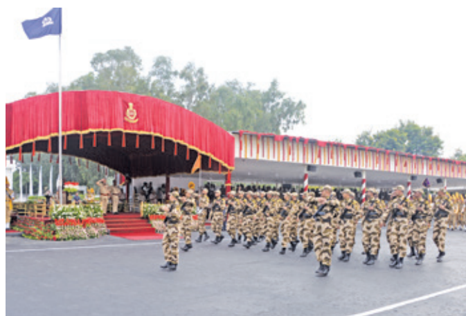
सीआईएसएफ कॉर्टिजेंट मंच से गुजरते हुए