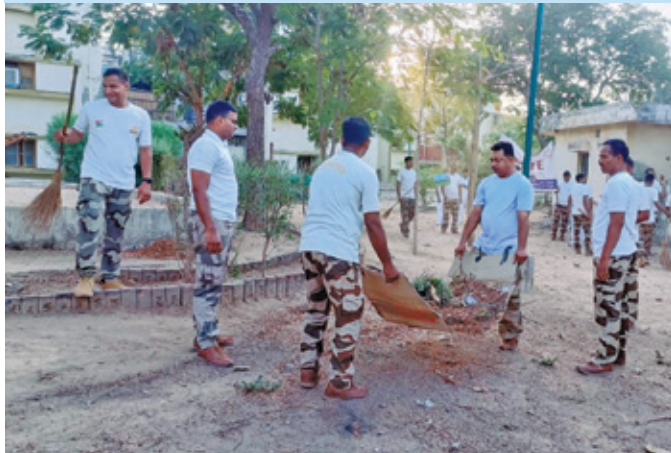
पीआरएल अहमदाबाद ( गुजरात )