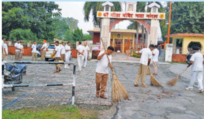
एनएफएल नंगल ( पंजाब )