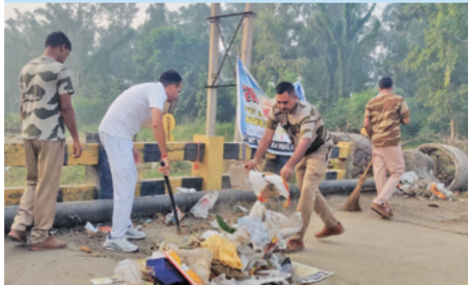
पीपीसीएल बवाना ( दिल्ली )