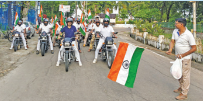
एएनजीपीपी अंटा ( राजस्थान )