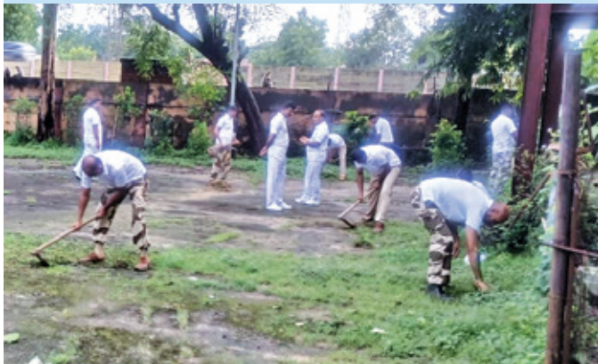
ओएनजीसी अहमदाबाद ( गुजरात )