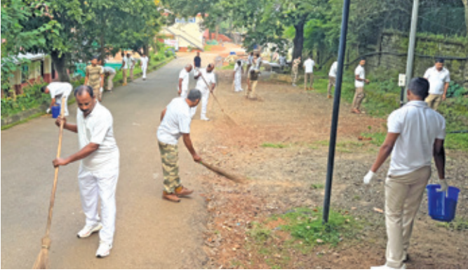
कालिकट एयरपोर्ट (केरल)