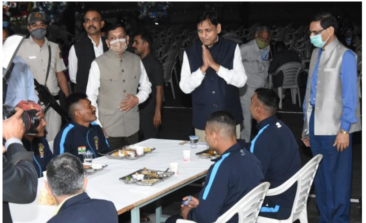
माननीय केन्द्रीय गृह राज्य मंत्री श्री नित्यानन्द राय जी रात्रि भोज में जवानों से मिलते हुए