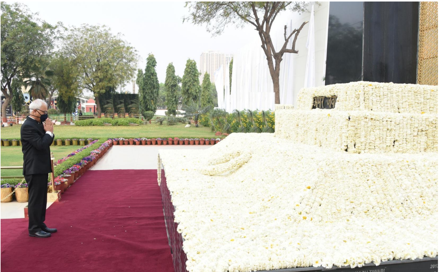
Hon'ble Union Home Secretary Shri Ajay Kumar Bhalla paying tribute to the Martyrs of CISF

On arrival at CISF campus, Indirapuram, Ghaziabad, Hon'ble Union Home Secretary Shri Ajay Kumar Bhalla paid tribute to the Martyrs of CISF at the Martyrs Memorial.