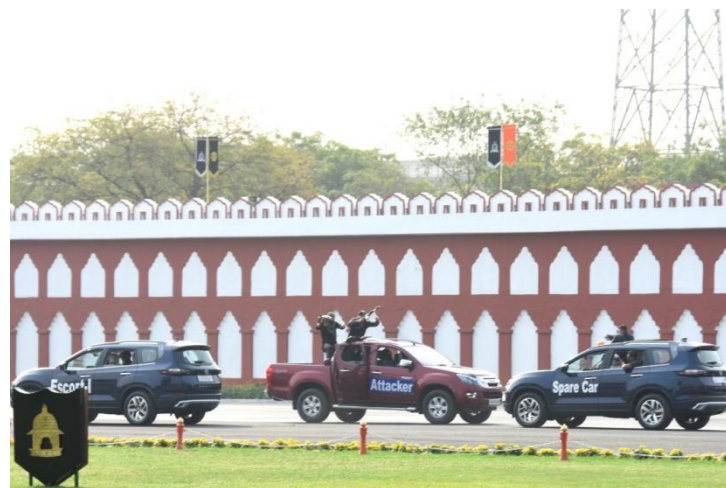
Demonstration on VIP security by CISF SSG personnel

Demonstrations on VIP Security, Silent Drill, Fire Safety and Rescue Drills were presented by the CISF personnel on the occasion. The demonstrations ended with tricolour formation using water jet spray by the Fire Wing personnel. Hon'ble Chief Guest and audience widely applauded the demonstrations.