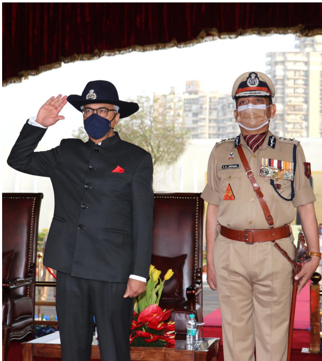
Hon'ble Union Home Secretary, Shri Ajay Kumar Bhalla takes the salute during the 52 nd CISF Raising Day Parade as 'Chief Guest'

The Central Industrial Security Force (CISF) celebrated its 52 nd CISF Raising Day in a grand and colourful manner at CISF Campus of 5 th Reserve Battalion, Indirapuram, Ghaziabad. On this occasion, Hon'ble Union Home Secretary Shri Ajay Kumar Bhalla was the Chief Guest. The Hon'ble Union Home Secretary took the salute and reviewed the parade.