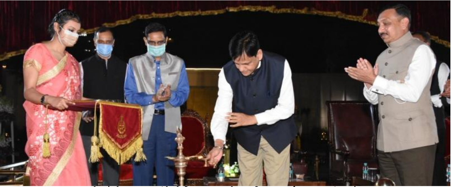
माननीय केन्द्रीय गृह राज्य मंत्री श्री नित्यानन्द राय दीप प्रज्वलित कर कार्यक्रम का शुभारंभ करते हुए