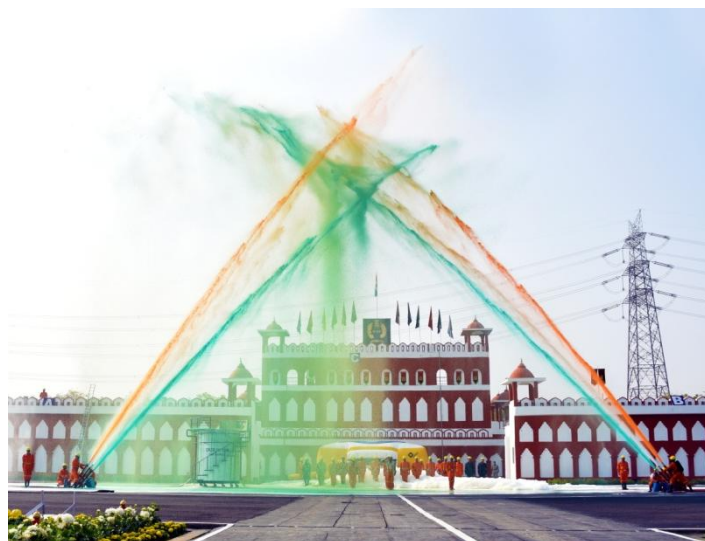
Tricolour formation with water jet spray

The Hon'ble Chief Guest interacted with the medal recipients, officers & other personnel and spent some time in the campus.