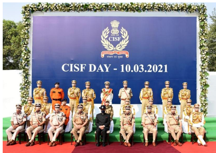
Hon'ble Union Home Secretary Shri Ajay Kumar Bhalla with Senior Officers of CISF, Parade Commander & Contingent Commanders