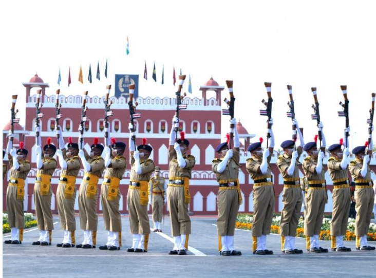
Demonstration on Silent Drill

Demonstrations on VIP Security, Silent Drill, Fire Safety and Rescue Drills were presented by the CISF personnel on the occasion. The demonstrations ended with tricolour formation using water jet spray by the Fire Wing personnel. Hon'ble Chief Guest and audience widely applauded the demonstrations.