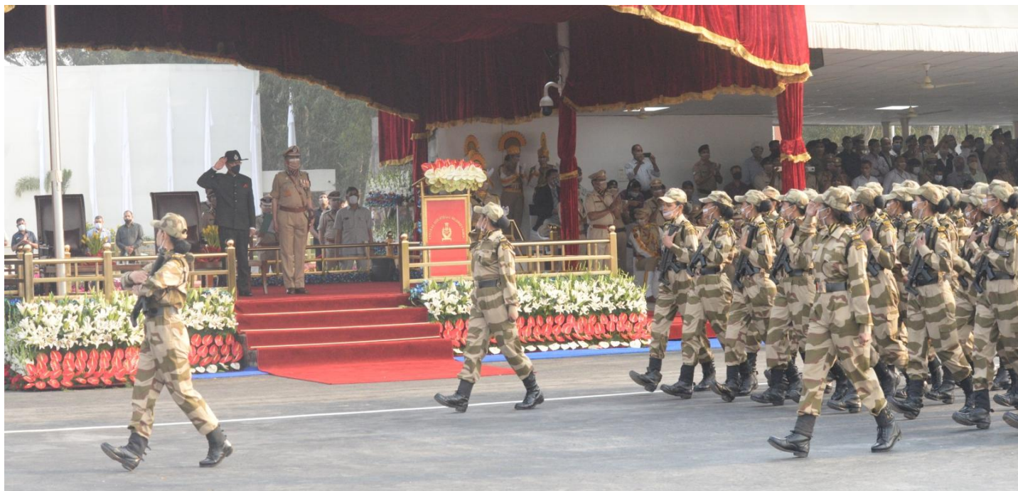
CISF women contingent passing through the dais