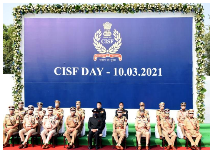
Hon'ble Union Home Secretary Shri Ajay Kumar Bhalla with Senior Officers of CISF & medal recipients

The Hon'ble Chief Guest interacted with the medal recipients, officers & other personnel and spent some time in the campus.