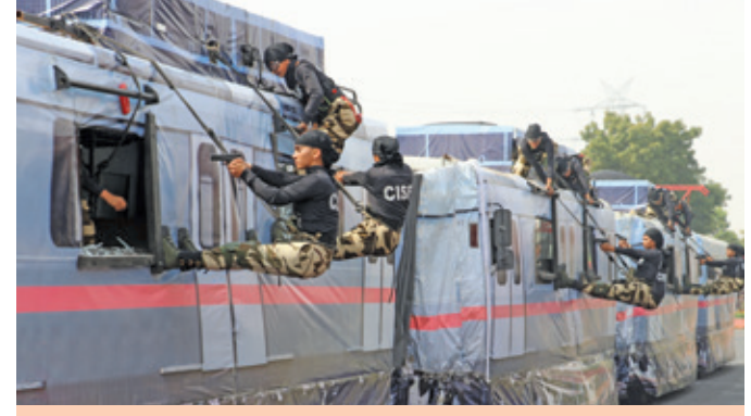
Spectacular demonstration by women personnel of CISF, STTW

Various demonstrations showcasing the capabilities of CISF, were presented by the CISF personnel on the occasion. The combat marshals of CISF presented "Kalaripayattu" martial art and the women commandos of Special Tactics and Training Wing (STTW) showcased their abilities in responding to various threats. The demonstrations ended with Tricolour formation using water jets spray by the CISF Fire Wing personnel.