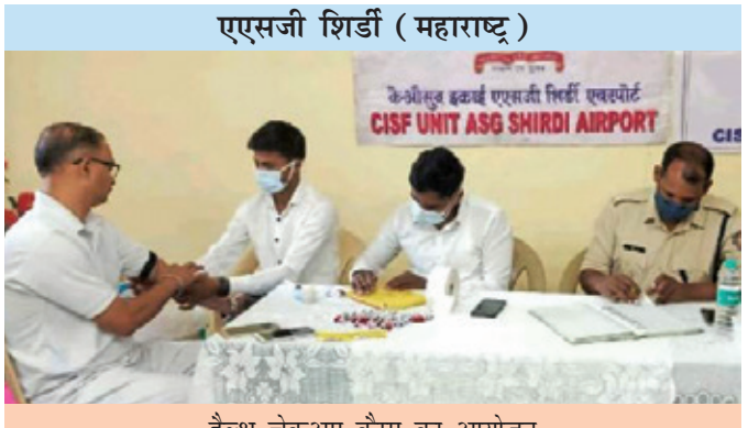
हैल्थ चेकअप कैम्प का आयोजन