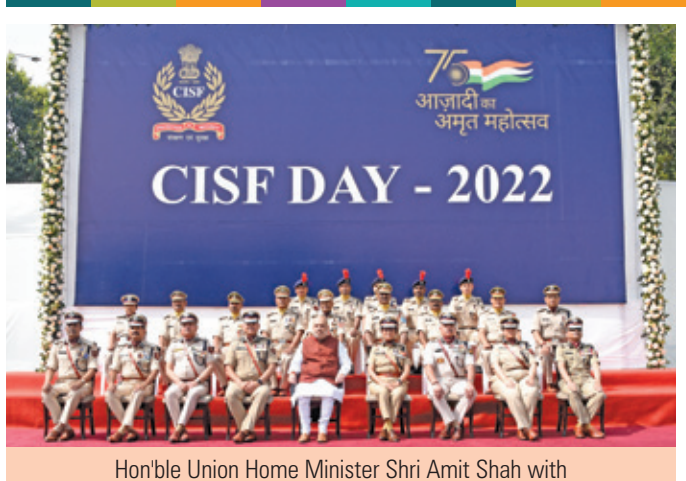
Senior Officers of CISF & medal recipients