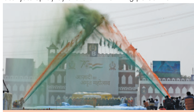
Tricolour formation by using water jets spray