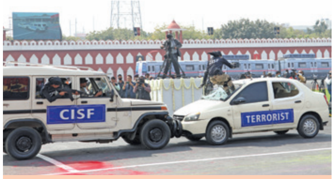
Dare-devil demonstration by women personnel of CISF, Special Tactics and Training Wing (STTW)

Various demonstrations showcasing the capabilities of CISF, were presented by the CISF personnel on the occasion. The combat marshals of CISF presented "Kalaripayattu" martial art and the women commandos of Special Tactics and Training Wing (STTW) showcased their abilities in responding to various threats. The demonstrations ended with Tricolour formation using water jets spray by the CISF Fire Wing personnel.