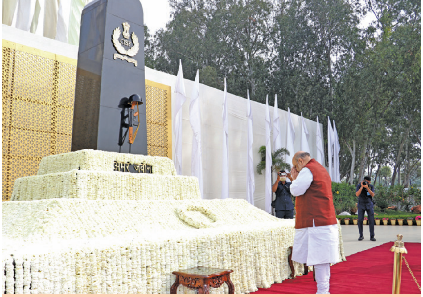
Hon'ble Union Home Minister of India, Shri Amit Shah paying tribute to the bravehearts of CISF who laid down their lives at the altar of duty is Sheel Vardhan Singh. Director General, CISE welcomed the Chief Guest and all the dignitaries present

On arrival at CISF Campus, Indirapuram, Ghaziabad, Hon'ble Union Home Minister paid tribute to the bravehearts of CISF at the 'Shaheed Smarak'.