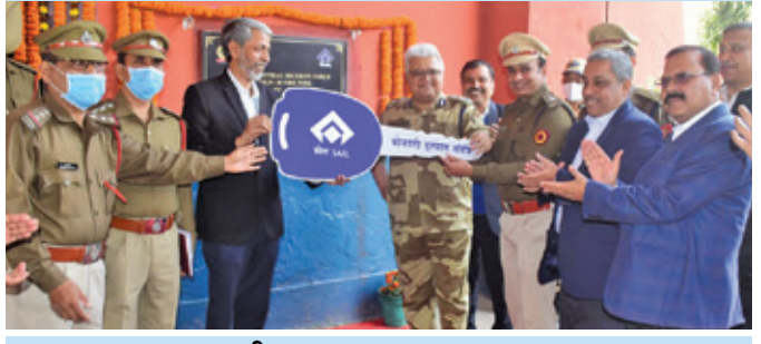
आरएपीएस रावतभाटा (राजस्थान)