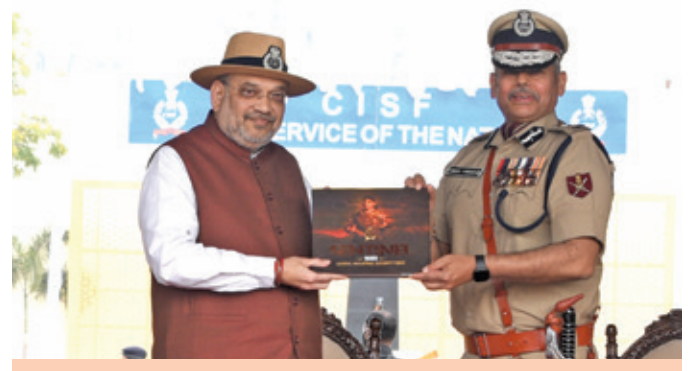
Hon'ble Union Home Minister, Shri Amit Shah released the CISF In-house Journal 'Sentinel'-2022