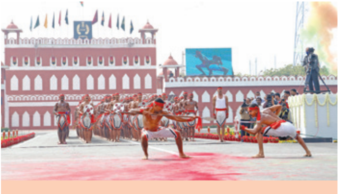
"Kalaripayattu" demonstration by CISF personnel

On this special occasion, CISF annual publication "Sentinel-2022" was released by the Hon'ble Union Home Minister.