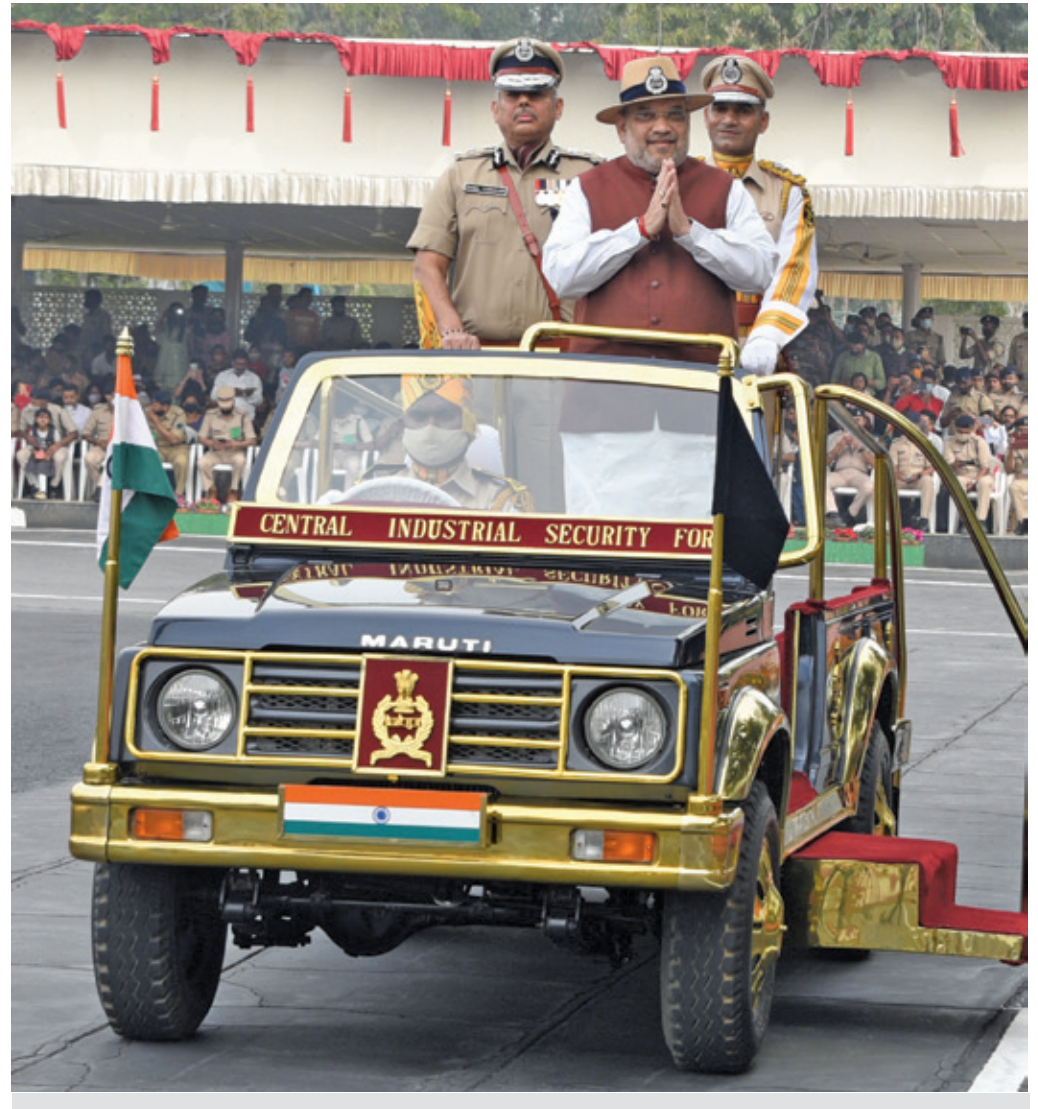
Hon'ble Union Home Minister of India, Shri Amit Shah during the function

The Central Industrial Security Force celebrated its 53<sup>rd</sup> Raising Day at CISF Campus 5<sup>th</sup> Reserve Battalion, Indirapuram, Ghaziabad. Hon'ble Union Home Minister of India, Shri Amit Shah graced the occasion as Chief Guest.