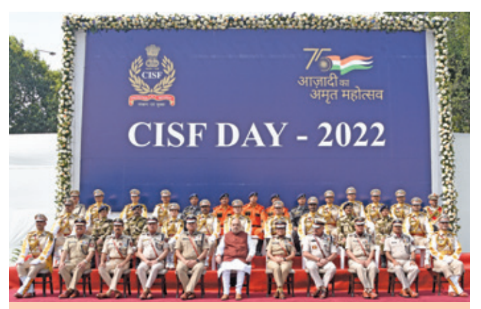
Hon'ble Union Home Minister Shri Amit Shah with Senior Officers of CISF, Parade Commander & Contingent Commanders