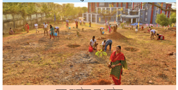
वृहद वृक्षारोपण का आयोजन