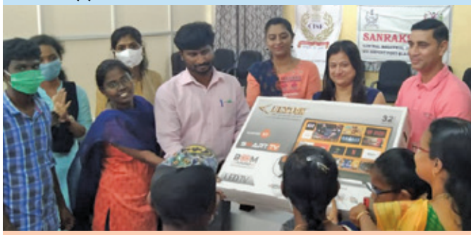
पोर्ट ब्लेयर के पुनर्वास केन्द्र के दिव्यांगों हेतु टीवी प्रदान किया गया