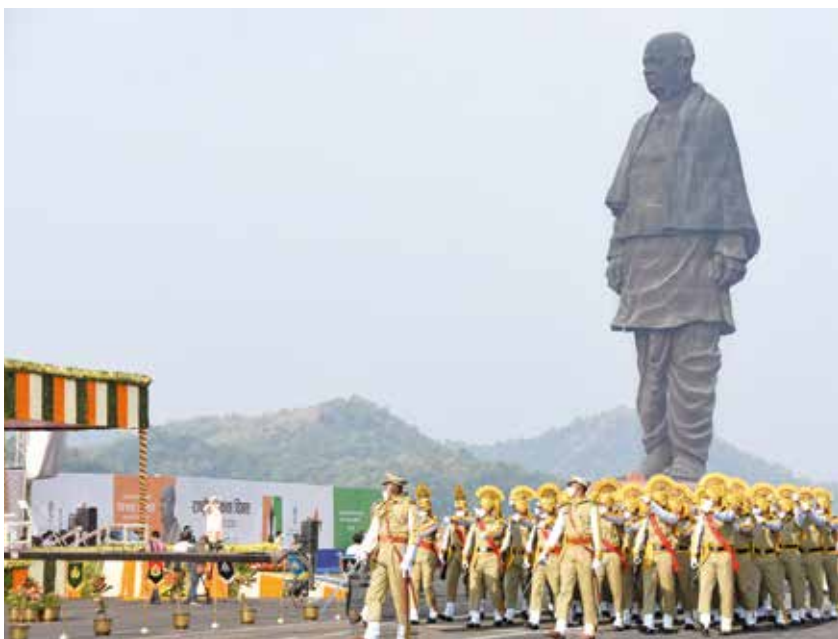
CISF contingent during the Rashtriya Ekta Diwas Parade at Kevadia, Gujarat

To commemorate the 145 th birth anniversary of Sardar Vallabhbhai Patel, the first Home Minister of India, ‘Rashtriya Ekta Diwas Parade’ was organized on 31 st October, 2020 in a grand manner at Kevadia, Gujarat. On the occasion, Hon’ble Prime Minister Shri Narendra Modi was the Chief Guest, who administered the ‘National Unity Day Pledge’ and reviewed the ‘Rashtriya Ekta Diwas Parade’ comprising of CAPFs and State Police Contingents. CISF contingent also participated in the ‘Ekta Diwas Parade’.