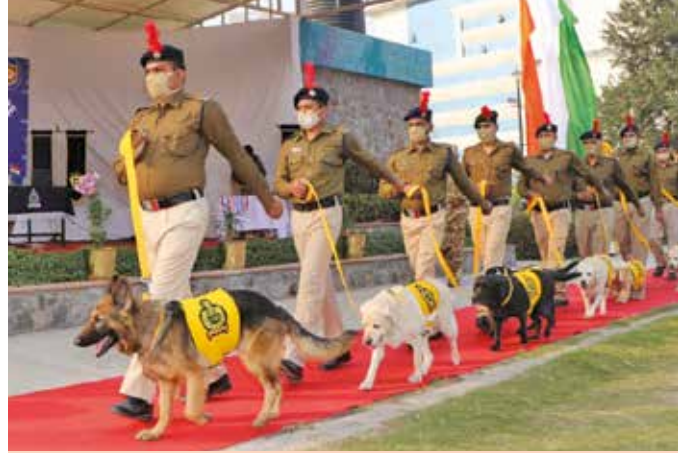
All eight canine with their handlers marching through the dais

On 24.12.2020 at 1500 hrs, CISF organised a ceremony to felicitate the eight (08) canines of CISF Unit DMRC Delhi, who retired after completing their successful tenure. After the basic training of six (06) months at CISF Dog Breeding Training Centre at CISF 5 th Reserve Battalion, Ghaziabad, these canines were detailed to perform tasks to keep DMRC safe and secure from multi-dimensional threats.