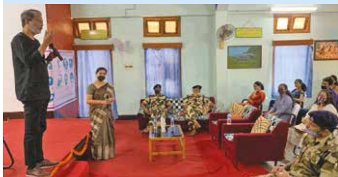
Mr. Adil Hussain, renowned film actor interacted with CISF personnel during the programme