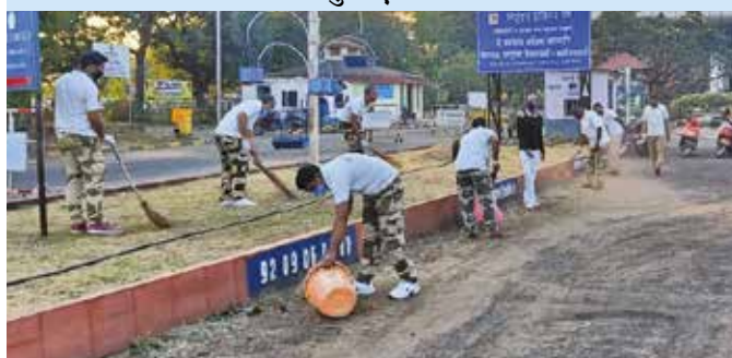
नागपुर एयरपोर्ट पर वृहद स्वच्छता अभियान