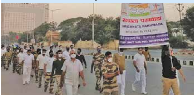
जन समूह को जागरूक करते हुए स्वच्छता रैली