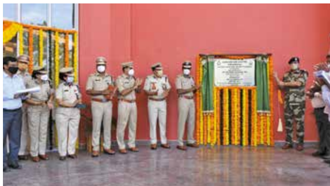
Shri Rajesh Ranjan, the then DG, CISF inaugurated the Convention Centre & Auditorium 'ANTARIKSH' at CISF NISA Hyderabad