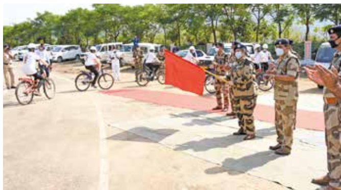
CISF cycle rally flagged-in at Statue of Unity, Kevadia on 30.10.2020

On 28.10.2020, to commemorate Rashtriya Ekta Diwas, a cycle rally was flagged-off from Sardar Vallabhbhai Patel Museum, Bardoli, District Surat to Statue of Unity, Kevadia covering a distance of 198 Km. 15 CISF personnel of CISF Unit IOCL Baroda participated in the rally.