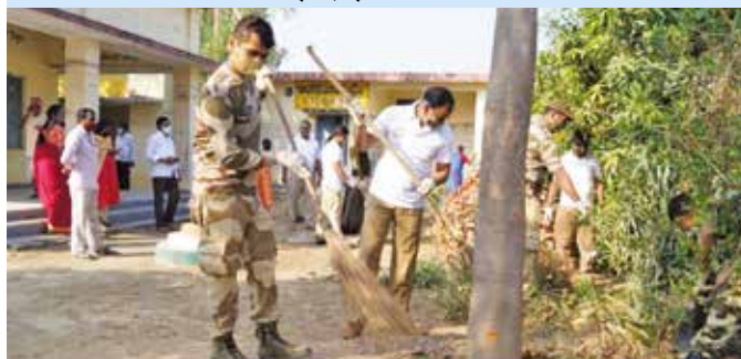
आमिनपुर गांव में वृहद स्वच्छता अभियान