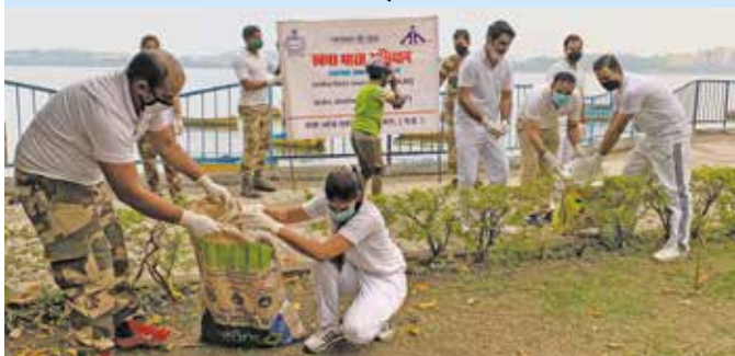
बोट क्लब भोपाल के आस-पास वृहद स्वच्छता अभियान