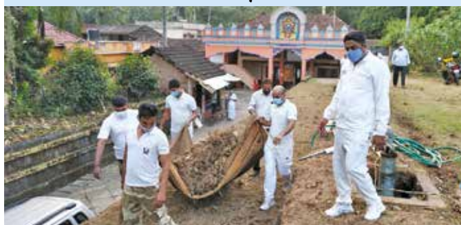
श्री अदिनाथेश्वर मन्दिर, आदयपड्डी में वृहद स्वच्छता अभियान