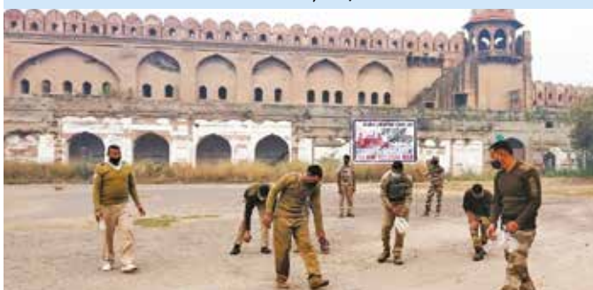
लालकिला के आस-पास वृहद स्वच्छता अभियान