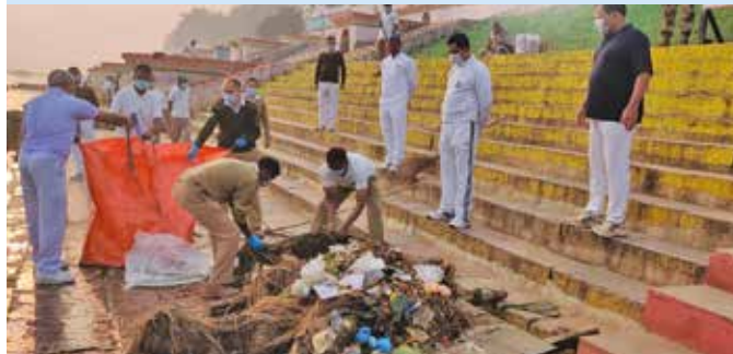
नर्मदा नदी के सेठानी घाट पर स्वच्छता अभियान