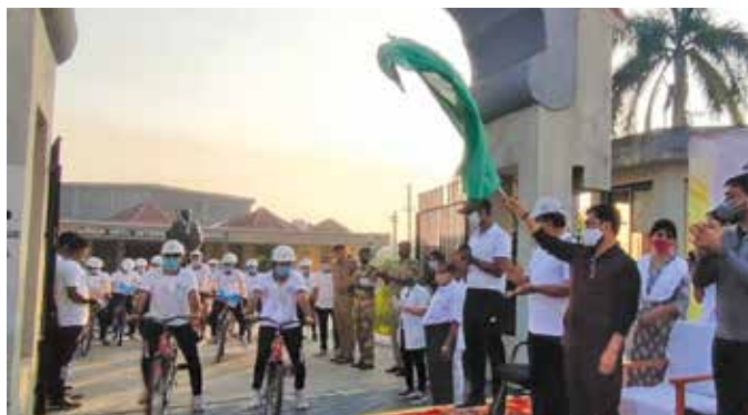
CISF cycle rally flagged-off from Sardar Vallabhbhai Patel Museum, Bardoli on 28.10.2020