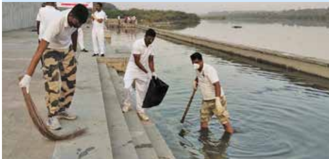
साबरमती नदी तट पर स्वच्छता अभियान